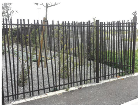
Modèle barreaudé en biais