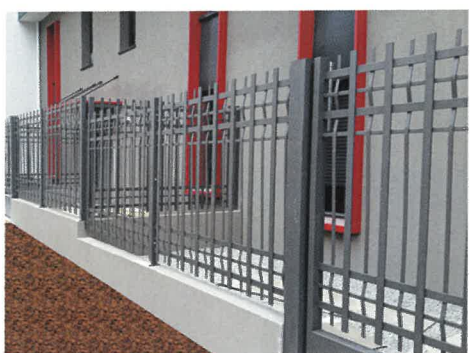
Modèle barreaudé mixte plat tressé