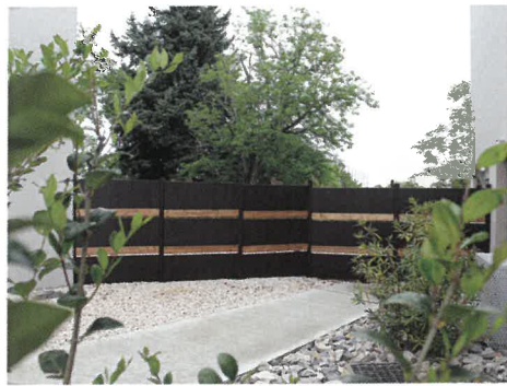
Modèle Claustra mixte acier-bois