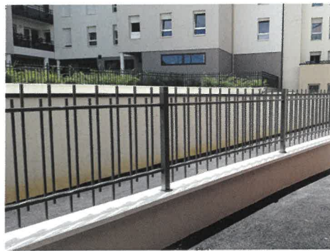
Modèle barreaudé sur muret