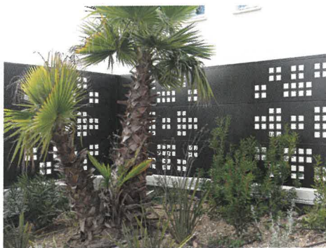
Modèle découpe laser